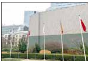
رفع علم البحرين بمقر المنظمة العالمية للجمارك في بروكسل

قالت المؤسسة الوطنية لحقوق الإنسان إنها تابعت باهتمام شديد موضوع معاناة الصيادين والبحارة البحرنيين، من جراء قيام دوريات خفر السواحل القطرية بملاحقتهم في أثناء قيامهم بممارسة مهنة الصيد في مناطق مختلفة من المياه الإقليمية لمملكة البحرين، إذ أسفرت تلك الملاحقات عن تضررهم جسدياً ومعنوياً ومادياً، وتم التعامل معهم بشكل تعسفي، الأمر الذي سبّب إلى جانب تعريض حياتهم للخطر، وحرمانهم من حرّمتهم وأمانهم الشخصي، تكديهم لخسائر مادية كبيرة ناجمة عن قطع مصدر رزقهم وروثق عائلاتهم الوحيد، إضافة إلى أن هذه التصرفات فيها خرق لكل أعراف الإنسانية والجيرة والأخوة بين أبناء