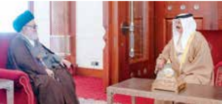
○ جلالة الملك خلال استقبال الشيخ عبدالله الغريفي.