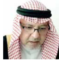
وزير العدل والشؤون الإسلامية والأوقاف